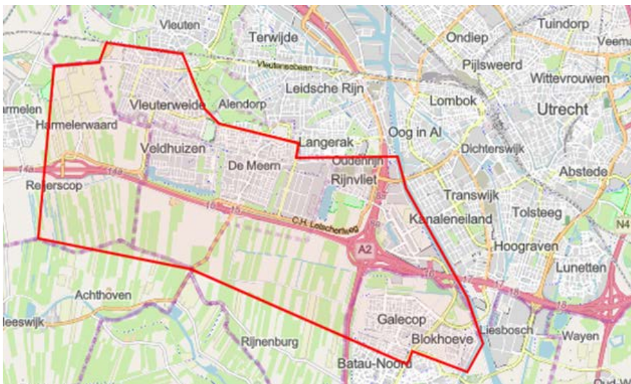
Figuur 1. Geografische indicatie van het congestiegebied.

Figuur 1 toont het gebied waar de congestie zich voordoet. Het gebied is het voorzieningsgebied van het 10 kV-station Oudenrijn. Dit station voedt de Utrechtse wijken Vleuterweide, De Meern en de bedrijventerreinen Oudenrijn en Papendorp plus de te ontwikkelen wijk Rijnvliet. In Nieuwegein voedt dit station de wijk Galecop.