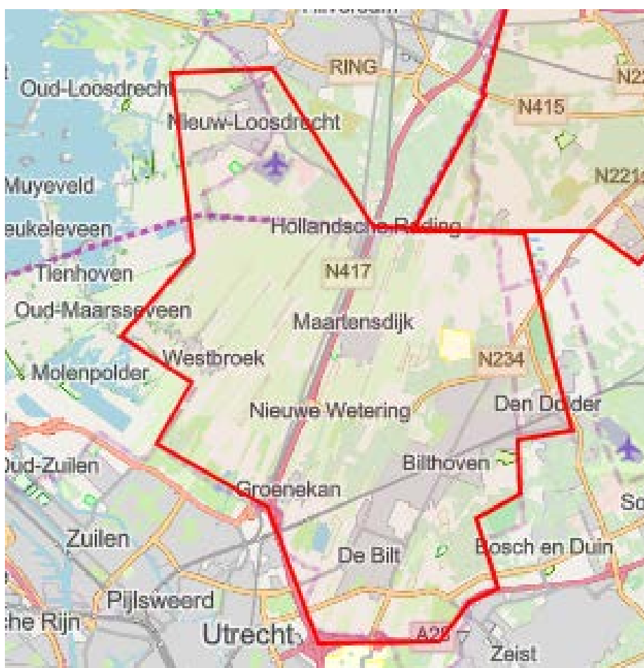
Figuur 1. Geografische indicatie van het congestiegebied.

Figuur 1 toont het gebied waar de congestie zich voordoet. Station Bilthoven voedt de dorpen Bilthoven, De Bilt, Den Dolder, Maartensdijk, Nieuw-Loosdrecht, Westbroek en Groenekan.